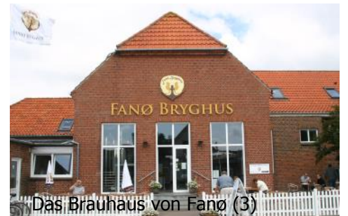
Das Brauhaus von Fanø (3)